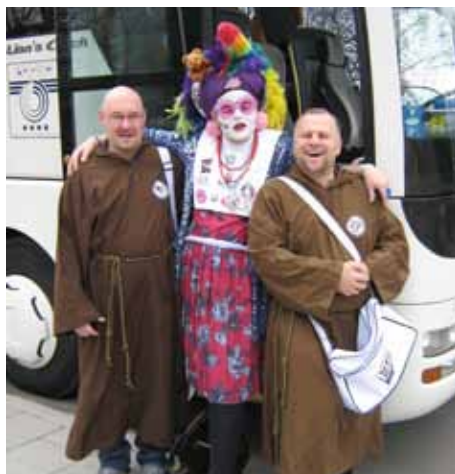
Sittenstrolche und eine Schwester der perpetuellen Indulgenz vor dem Shuttlebus

Die Besucherzahl war erstaunlich hoch. Bemerkenswert war, dass ca. 50% der Messebesucher Lesben waren. Dafür, dass die Veranstaltung erstmals in München stattfand, waren die Besucherzahlen in Ordnung. Die Bewerbung war allerdings eher mangelhaft.