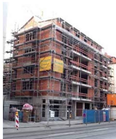
Die Baustelle Müllerstraße 14 Ende März von außen. Innenansichten auf Seite 3.

Das Sub ist dabei, wenn sich einmal im Jahr gut 100 Spielorte zu diesem Musikfestival zusammen schließen: In der Münchner Innenstadt werden dann über 400 Livekonzerte, Tanzdarbietungen, Kabarett und Führungen rund um das Thema Musik geboten. Der Besucher hat mit einem Kombiticket für 15 Euro Zutritt zu allen