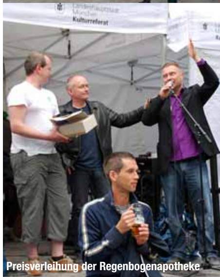
Preisverleihung der Regenbogenapotheke