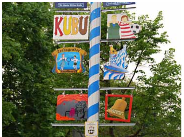
Infostand des Aktionsbündnis für Solidarität anlässlich des International Day Against Homophobia am 17. Mai – Neue Tafeln am Integrationsmaibaum auf dem Karl-Heinrich-Ulrichs-Platz. Bericht auf Seite 4, mehr Fotos vom Maifest auf Seite 6