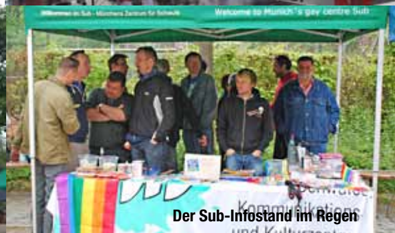
Der Sub-Infostand im Regenbogen