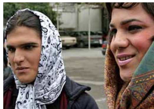
Szene aus „Be Like Others“

Als Einstimmung auf den IDAHO am 17. Mai lief die Dokumentation „Be Like Others“ in der englischen Originalfassung. Dieser Film behandelte das Thema Schwule und Lesben im Iran, die sich einer Geschlechtsumwandlung unterzie-