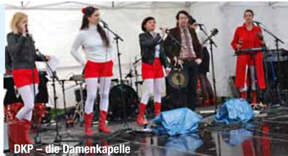
DKP – die Damenkapelle

Fotos Horst Middelhoff, Bericht auf Seite 4