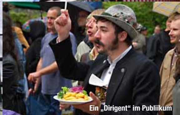
Ein „Dirigent“ im Publikum